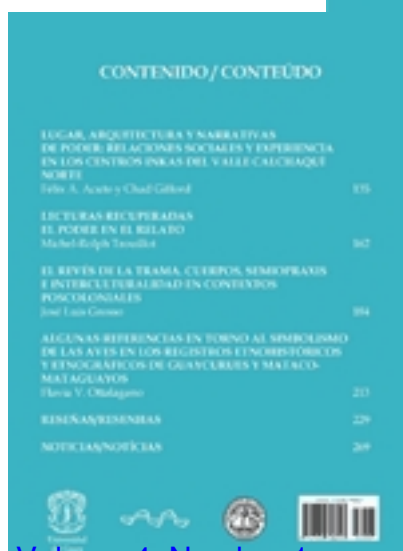
Volume 4, Number 1