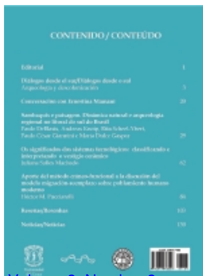
Volume 3, Number 2